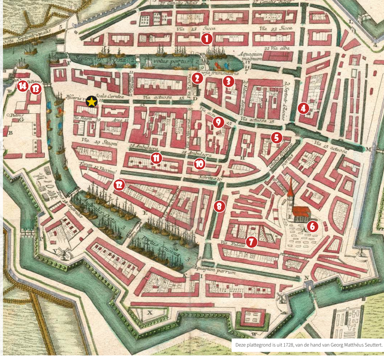
Deze plattegrond is uit 1728, van de hand van Georg Matthäus Seutter.

Je bent óók welkom in 13 andere monumentale panden. In sommige zijn extra activiteiten, die deels overlappen met het nieuwe UITfestival Harlingen. Kijk achterop de folder voor meer informatie!